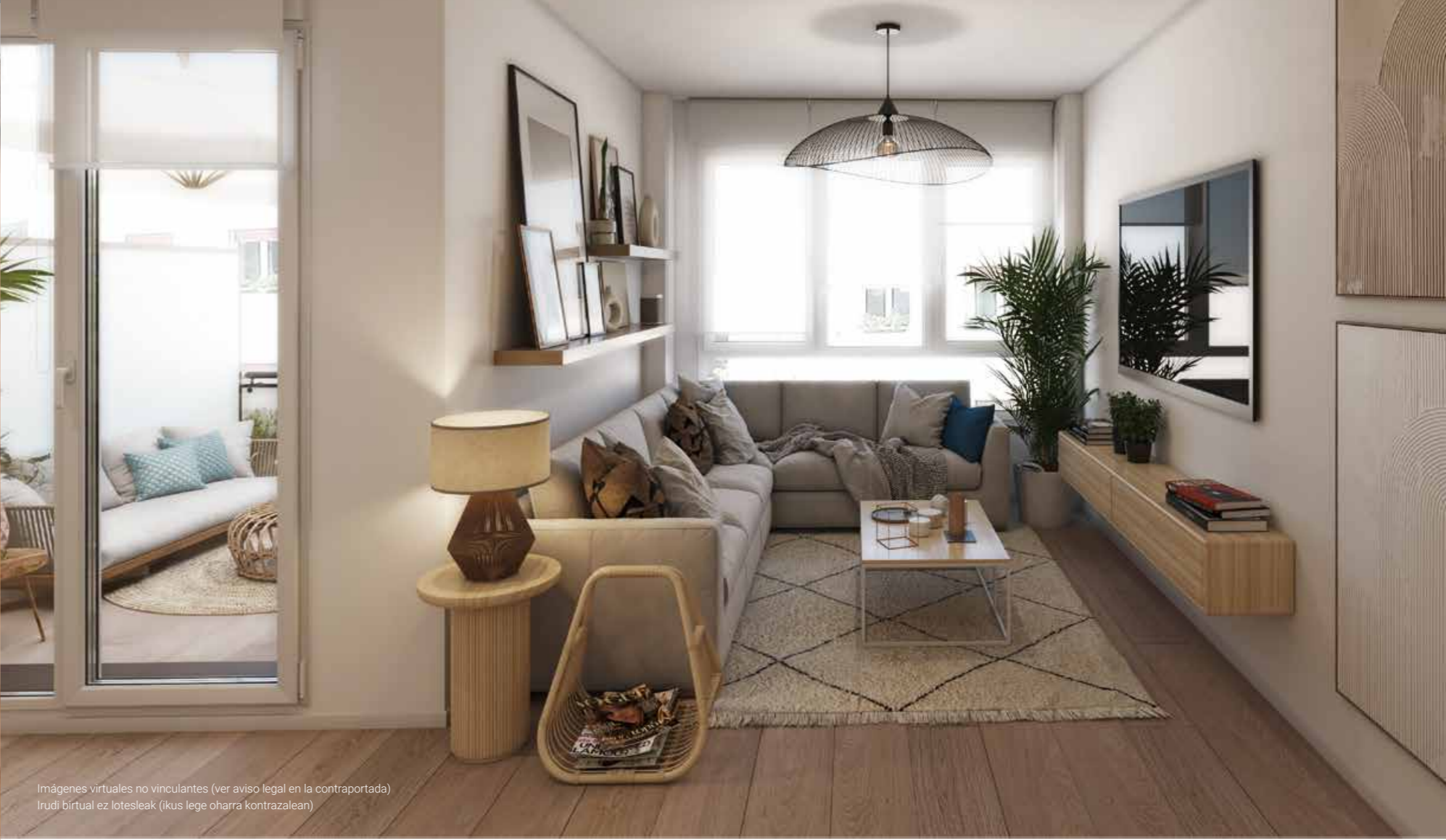
Imágenes virtuales no vinculantes (ver aviso legal en la contraportada) Irudi birtual ez lotesleak (ikus lege oharra kontrazalean)

Viviendas a 2 fachadas muy luminosas todo el día. Con 2 dormitorios y una terraza extra en la planta tercera. ¡No la dejes escapar!