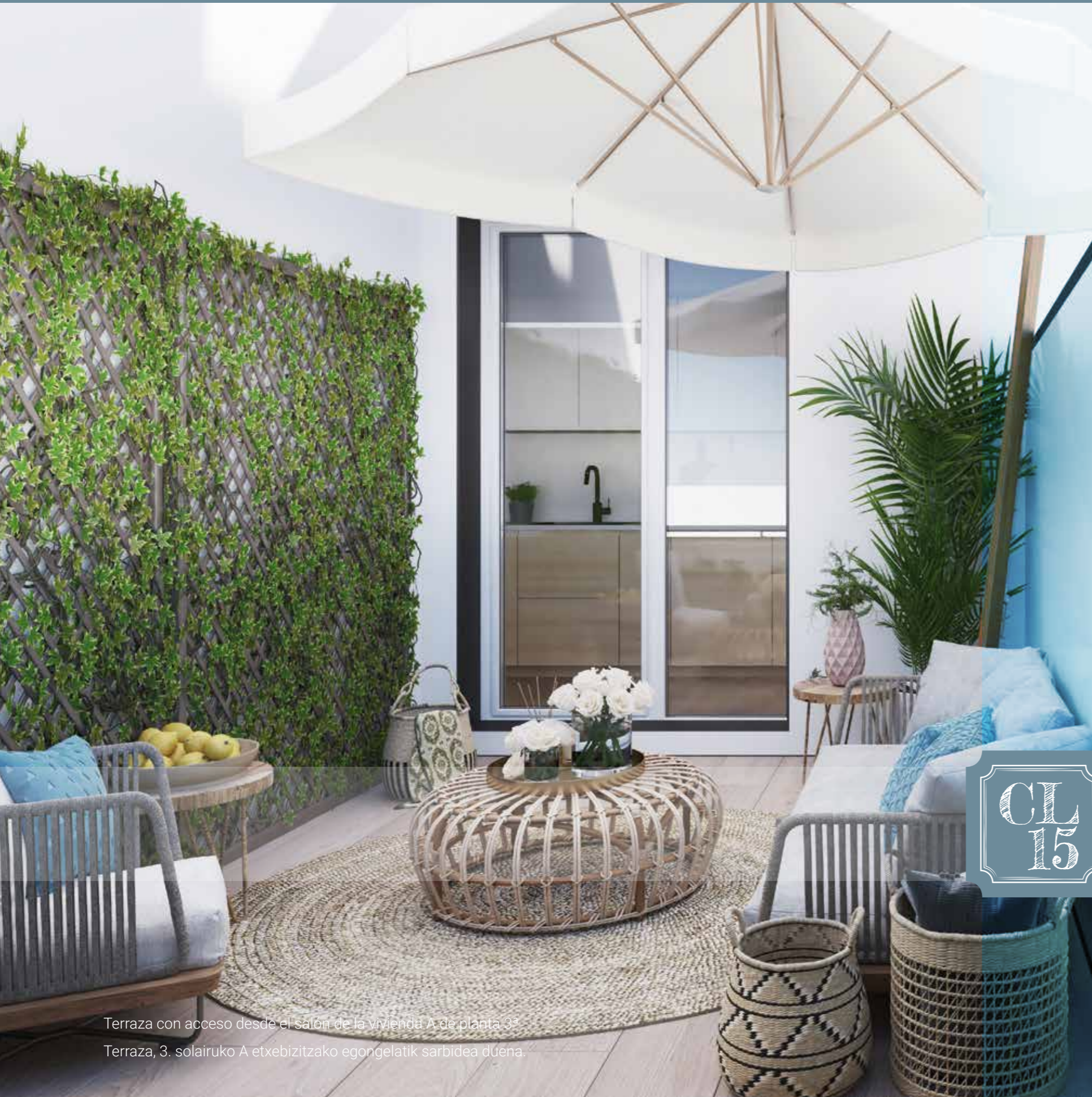
Terraza con acceso desde el salón de la vivienda A de planta 3ª Terraza, 3. solairuko A etxebizitzako egongelatik sarbidea duena.