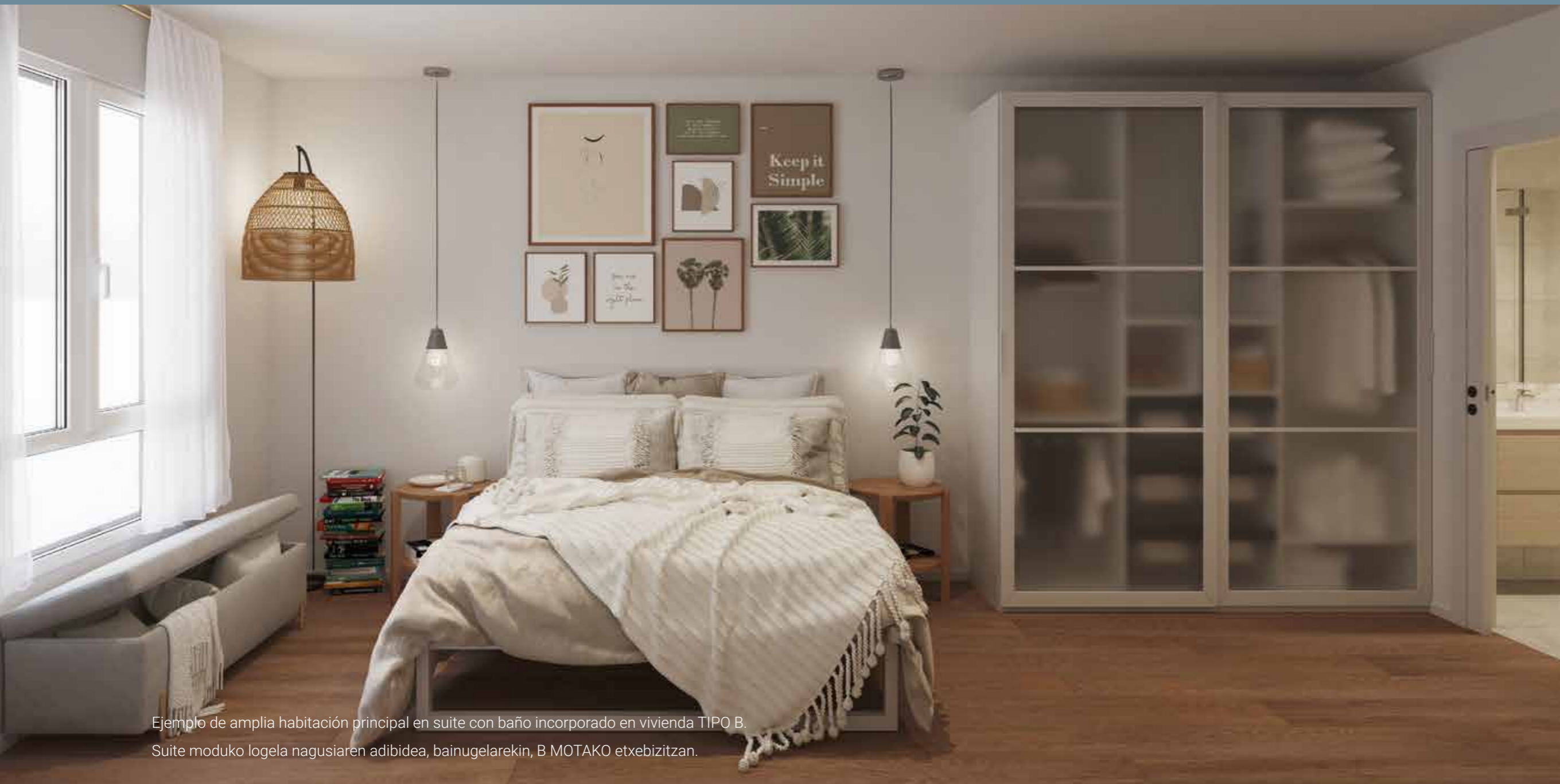
Ejemplo de amplia habitación principal en suite con baño incorporado en vivienda TIPO B. Suite moduko logela nagusiaren adibidea, bainugelarekin, B.MOTAKO etxebizitzan.