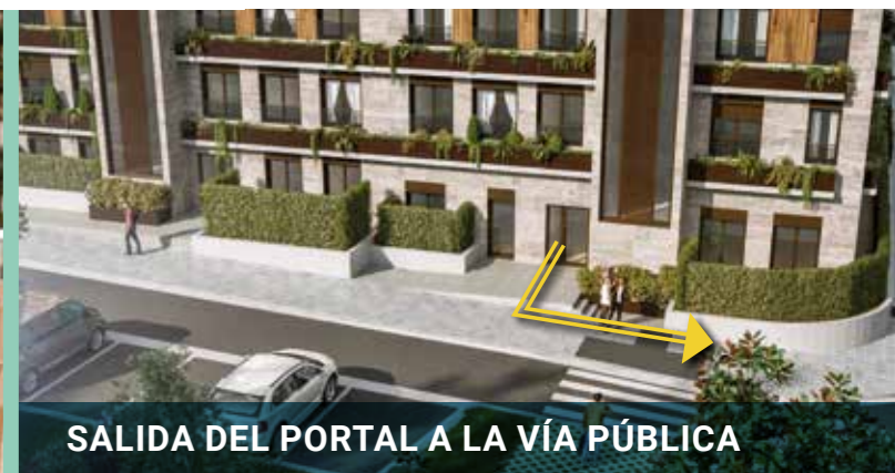
SALIDA DEL PORTAL A LA VÍA PÚBLICA