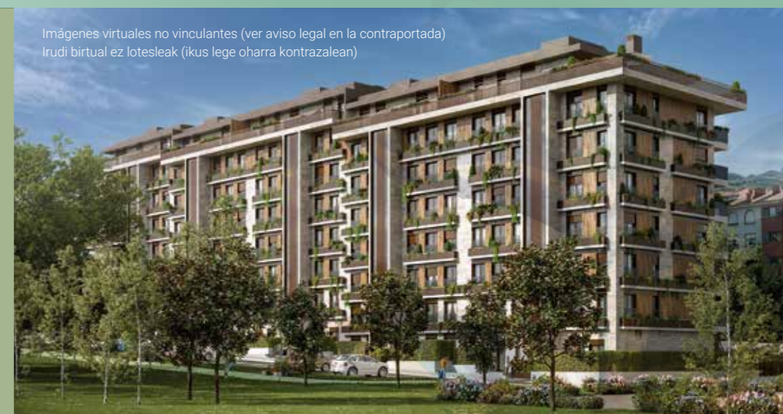
Imágenes virtuales no vinculantes (ver aviso legal en la contraportada) Irudi birtual ez lotesleak (ikus lege oharra kontrazalean)