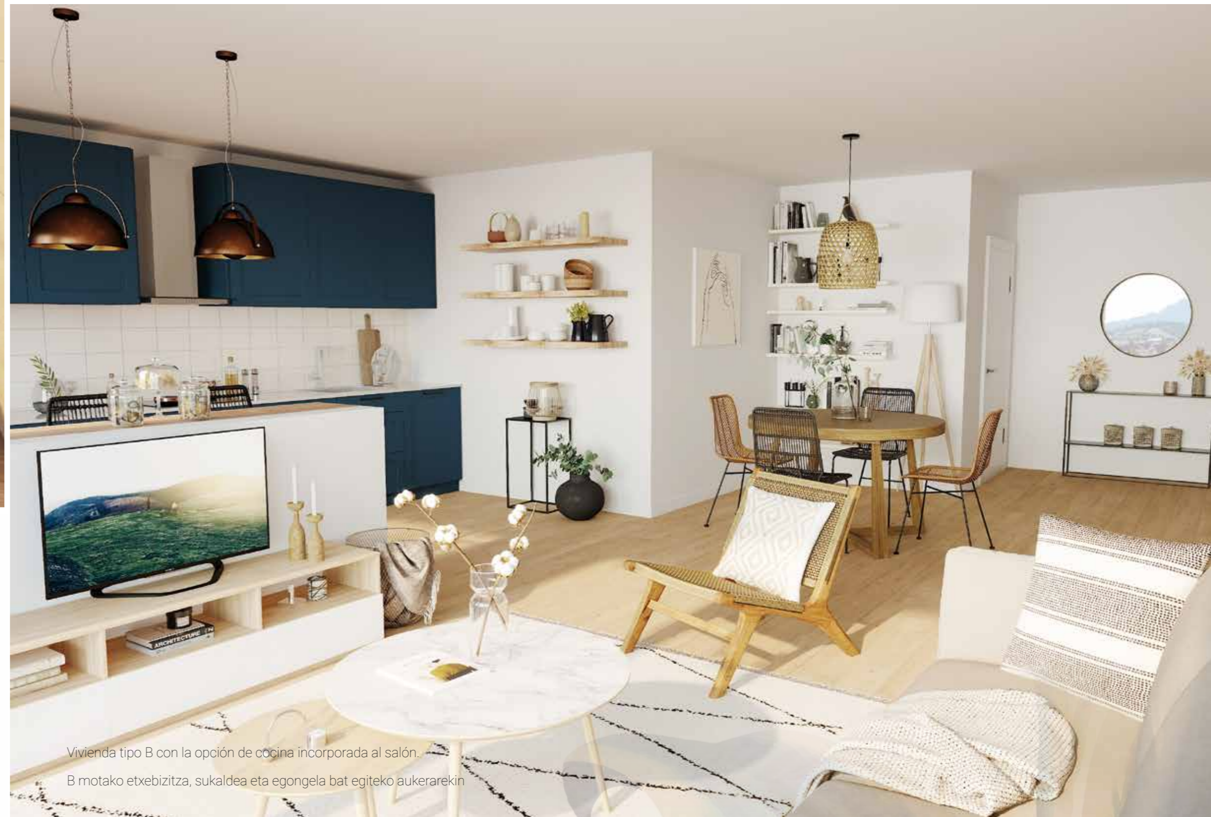
Vivienda tipo B con la opción de cocina incorporada al salón. B motako etxebizitza, sukaldea eta egongela bat egiteko aukerarekin