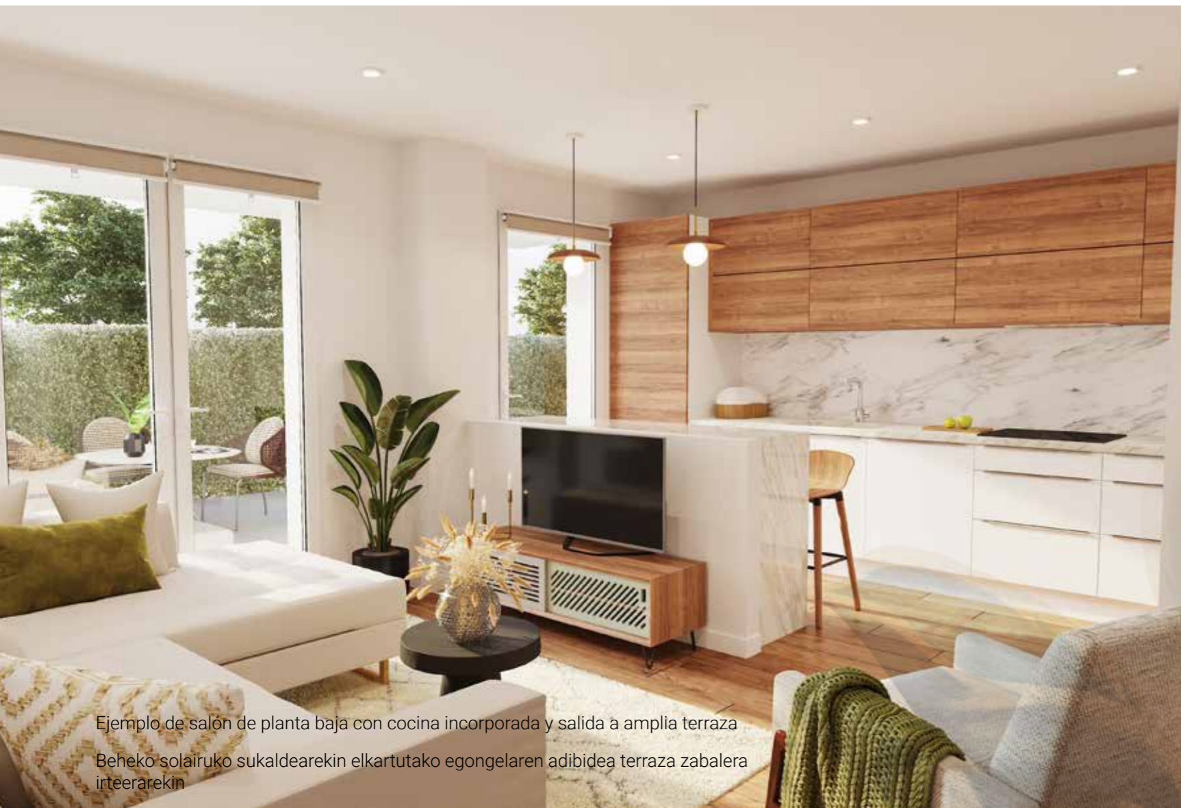
Ejemplo de salón de planta baja con cocina incorporada y salida a amplia terraza Beheko solairuko sukaldearekin elkartutako egongelaren adibidea terraza zabalera irteerarekin