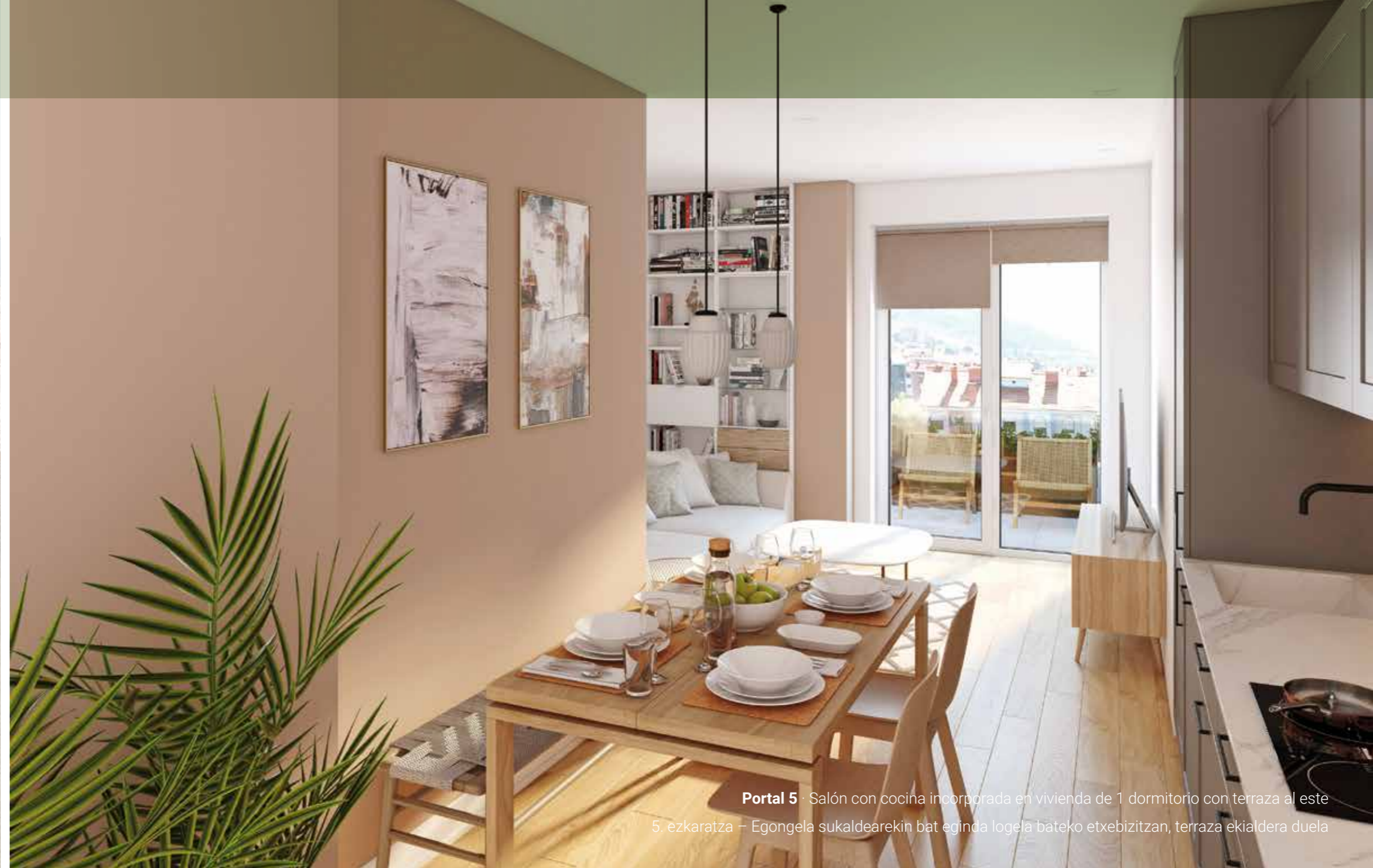
Portal 5 · Salón con cocina incorporada en vivienda de 1 dormitorio con terraza al este 5. ezkaratza - Egongela sukaldearekin bat eginda logela bateko etxebizitza, terraza ekialdera duela

Imágenes virtuales no vinculantes (ver aviso legal en la contraportada) Irudi birtual ez lotesleak (ikus lege oharra kontrazalean)