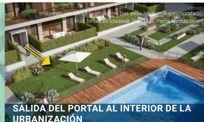
SALIDA DEL PORTAL AL INTERIOR DE LA URBANIZACIÓN