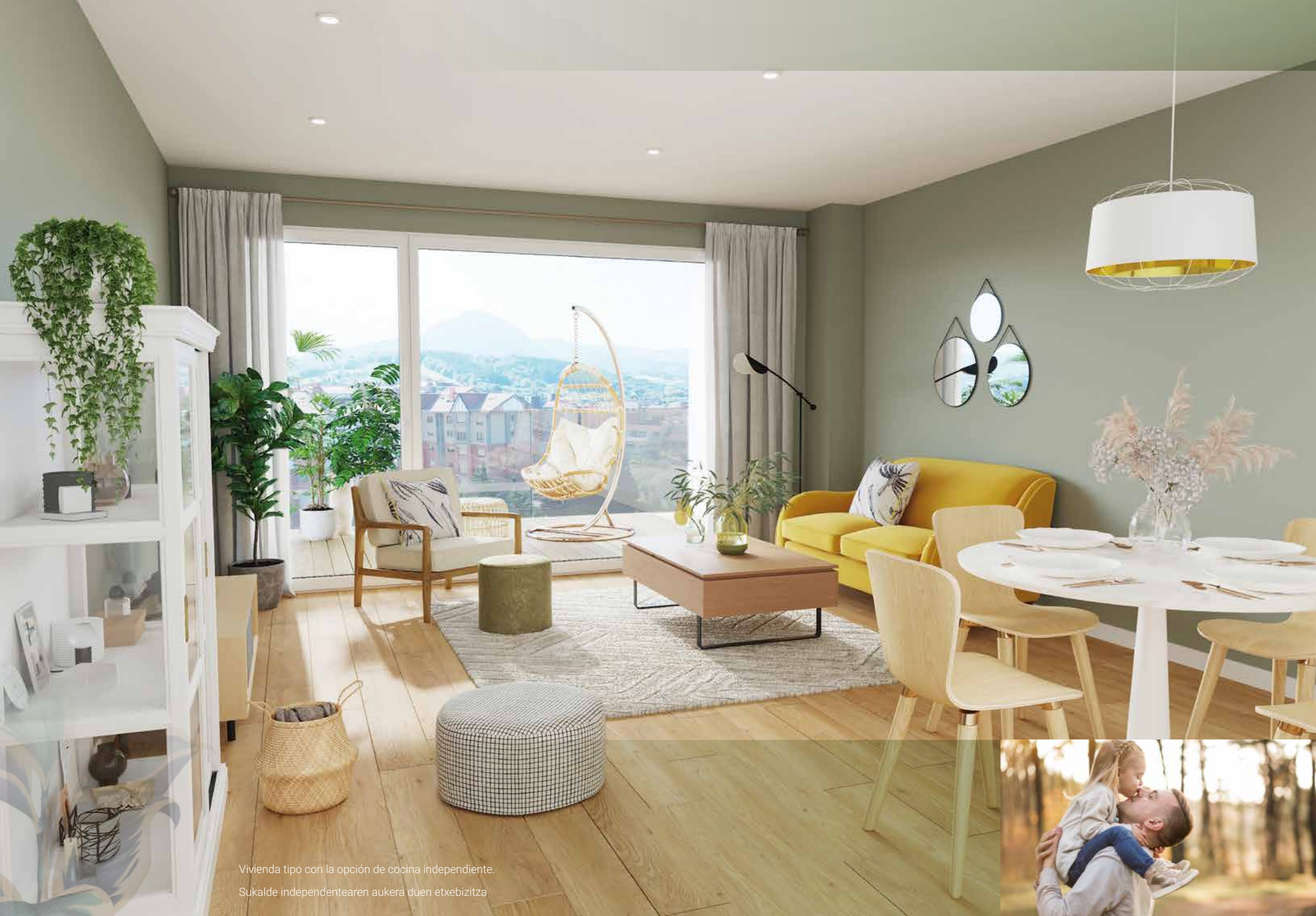
Vivienda tipo con la opción de cocina independiente. Sukalde independentearen aukera duen etxebizitza