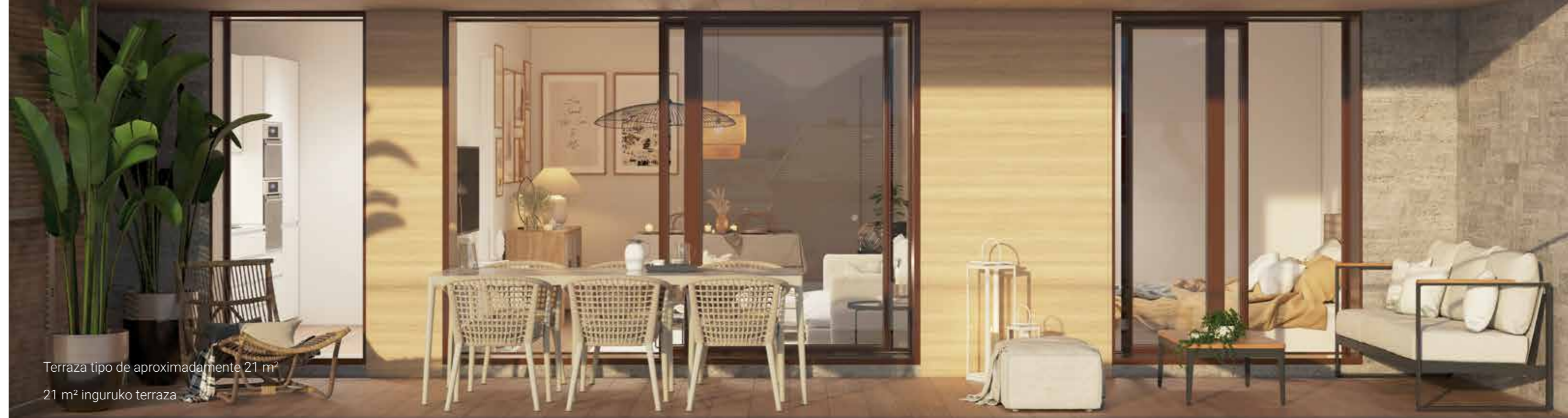
Terraza tipo de aproximadamente 21 m 2 21 m 2 inguruko terraza

Durangunear logela nagusia zain duzu, ekipamendu osoarekin : horma-armairu handiak pertsonalizatzeko aukerarekin, kalitate oneneko xehetasun guztiak dituen logela barruko bainua eta terrazara irteerarekin eskuragarri dauden etxebizitza-tipologia askotan.