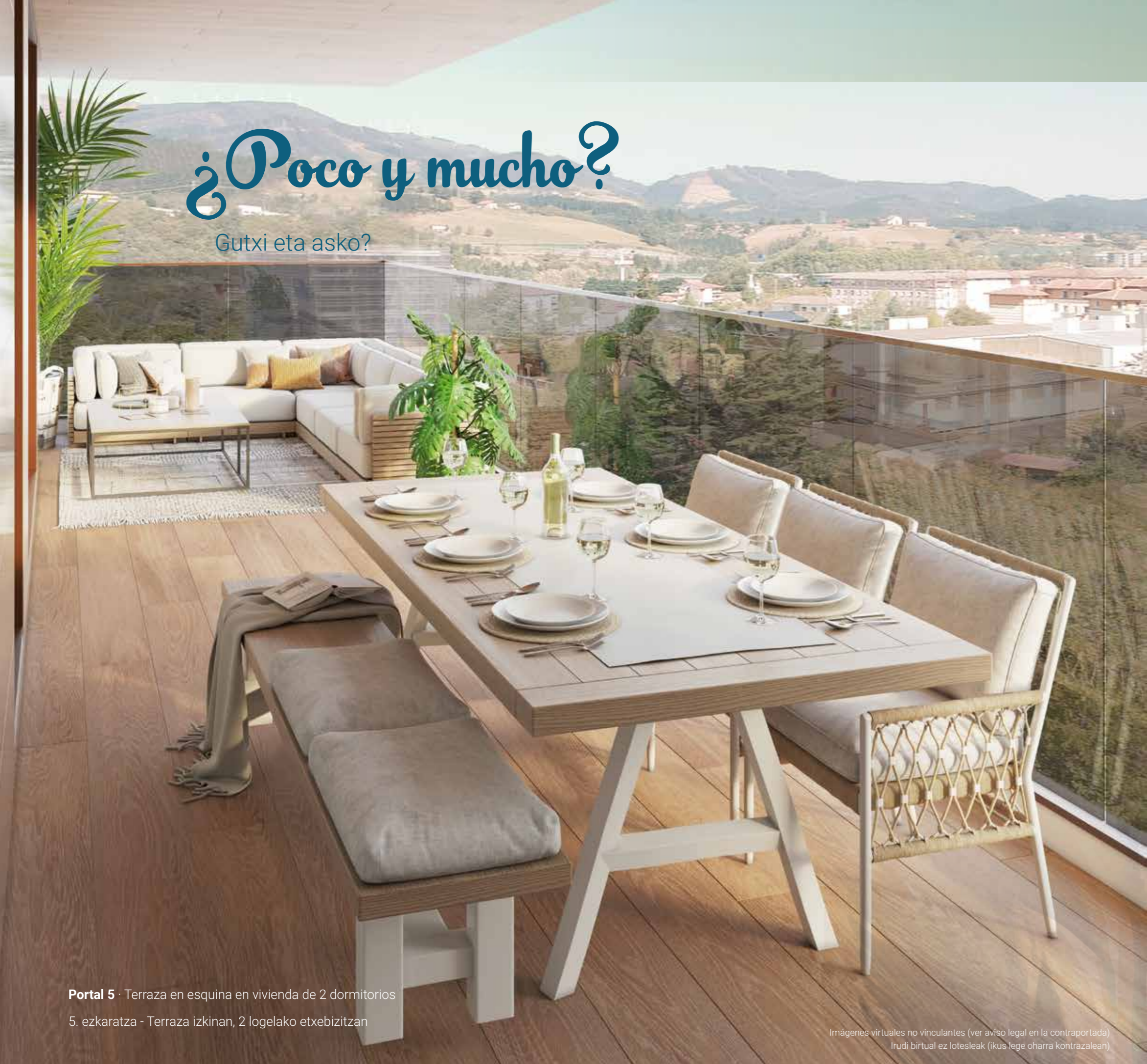
Portal 5 · Terraza en esquina en vivienda de 2 dormitorios 5. ezkaratza - Terraza izkinan, 2 logelako etxebizitza

Imágenes virtuales no vinculantes (ver aviso legal en la contraportada) Irudi birtual ez lotesleak (ikus lege oharra kontrazalean)