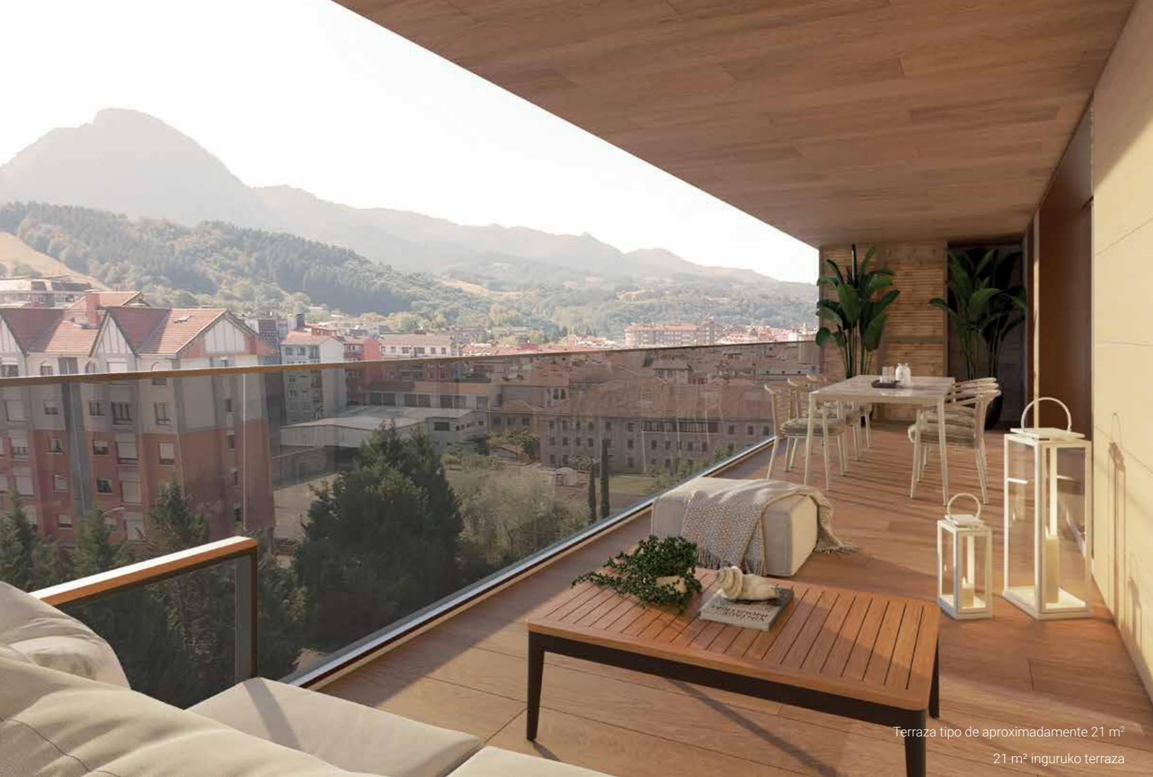
Terraza tipo de aproximadamente 21 m 2 21 m 2 inguruko terraza