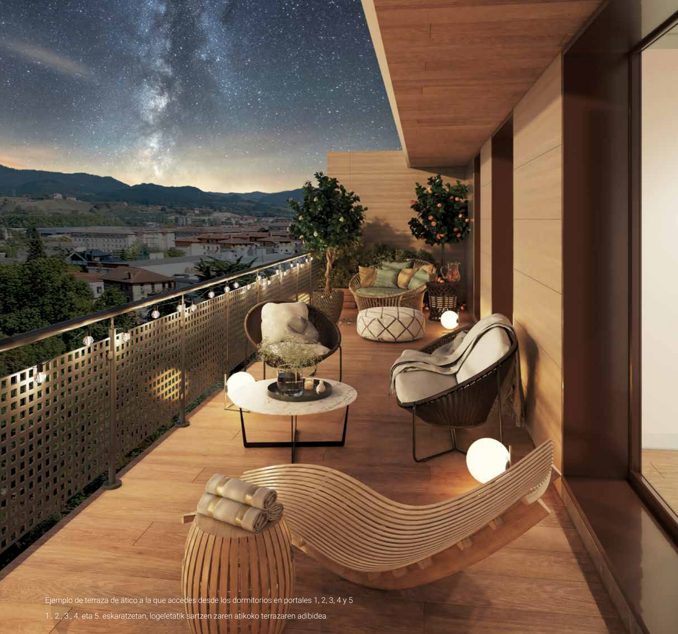
Ejemplo de terraza de ático a la que accedes desde los dormitorios en portales 1, 2, 3, 4 y 5 1., 2., 3., 4. eta 5. eskaratzetan, logeletatik sartzen zaren atikoko terrazaren adibidea