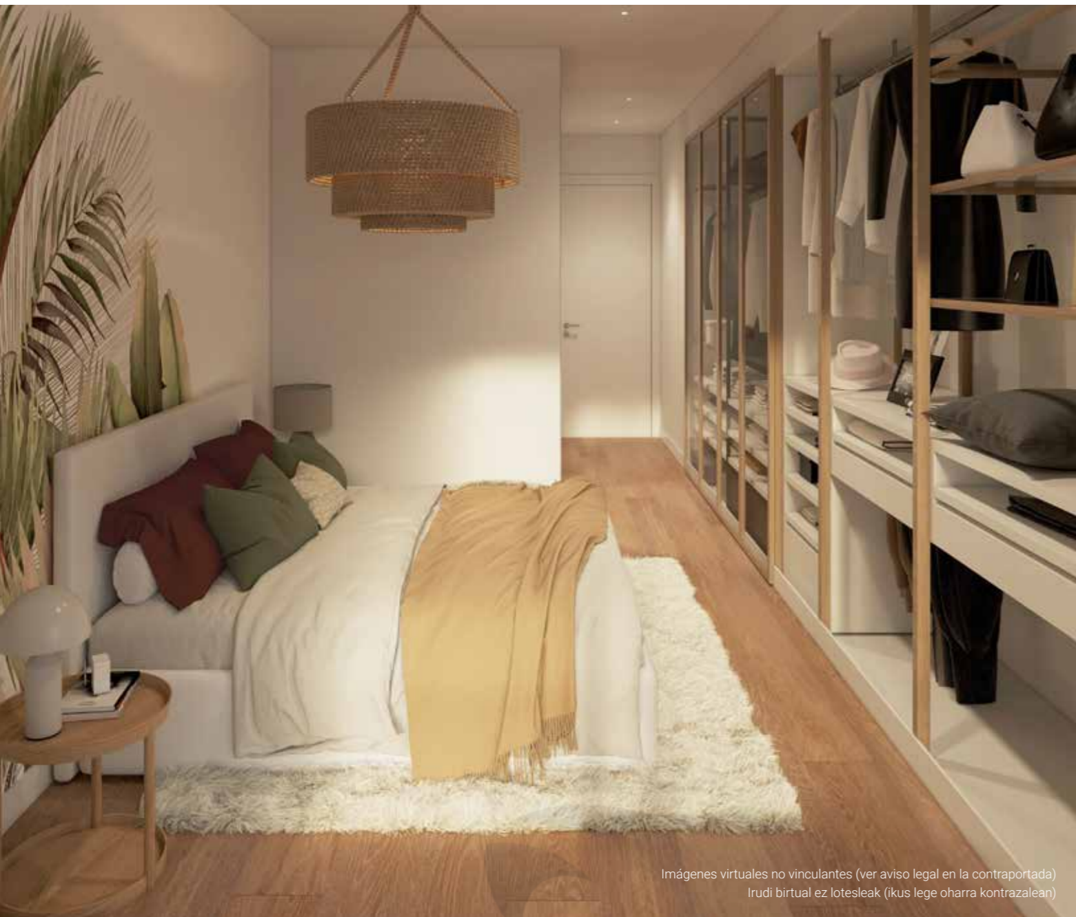
Imágenes virtuales no vinculantes (ver aviso legal en la contraportada) Irudi birtual ez lotesleak (ikus lege oharra kontrazalean)