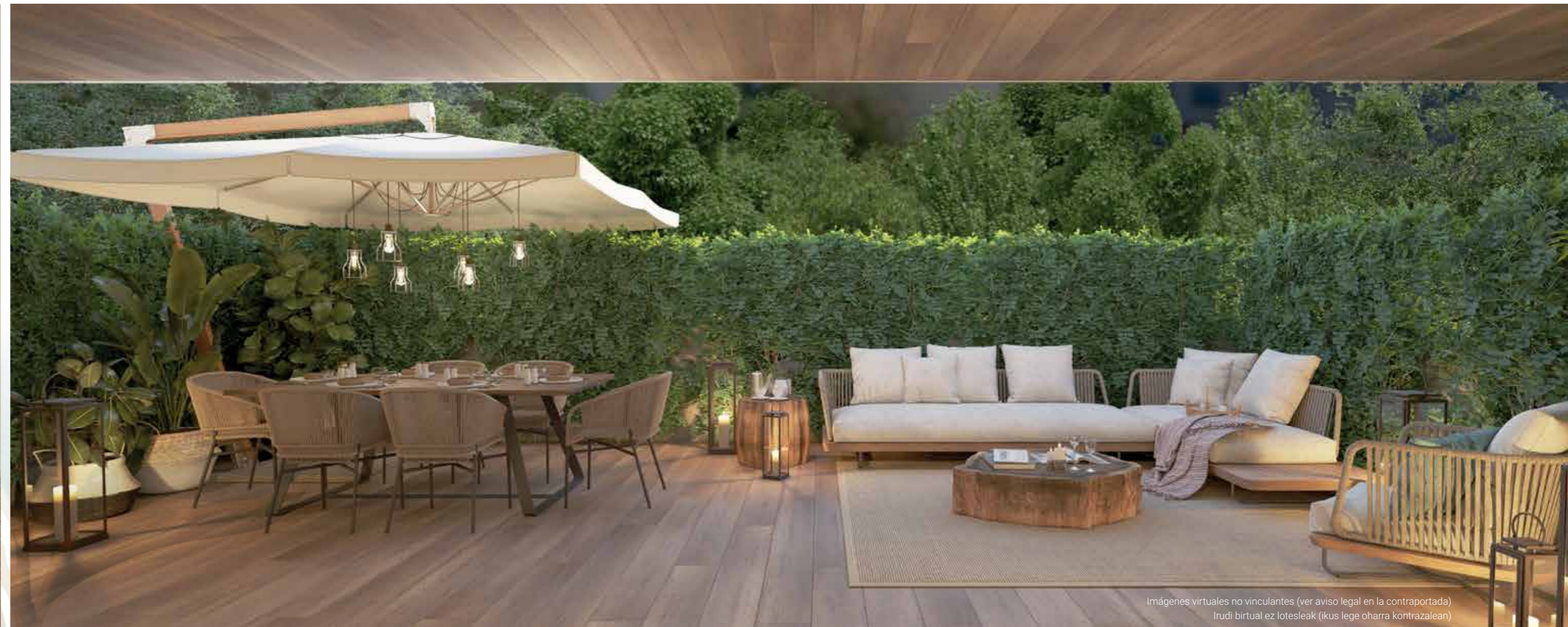
Imágenes virtuales no vinculantes (ver aviso legal en la contraportada) Irudi birtual ez lotesleak (ikus lege oharra kontrazalean)