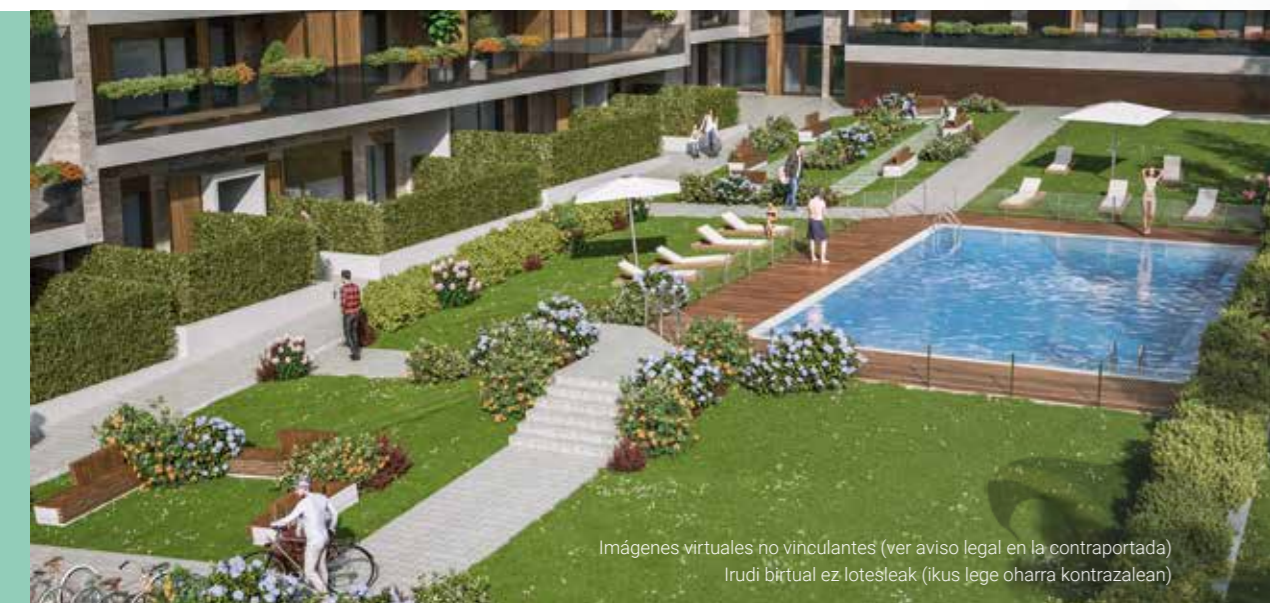
Imágenes virtuales no vinculantes (ver aviso legal en la contraportada) Irudi birtual ez lotesleak (ikus lege oharra kontrazalean)