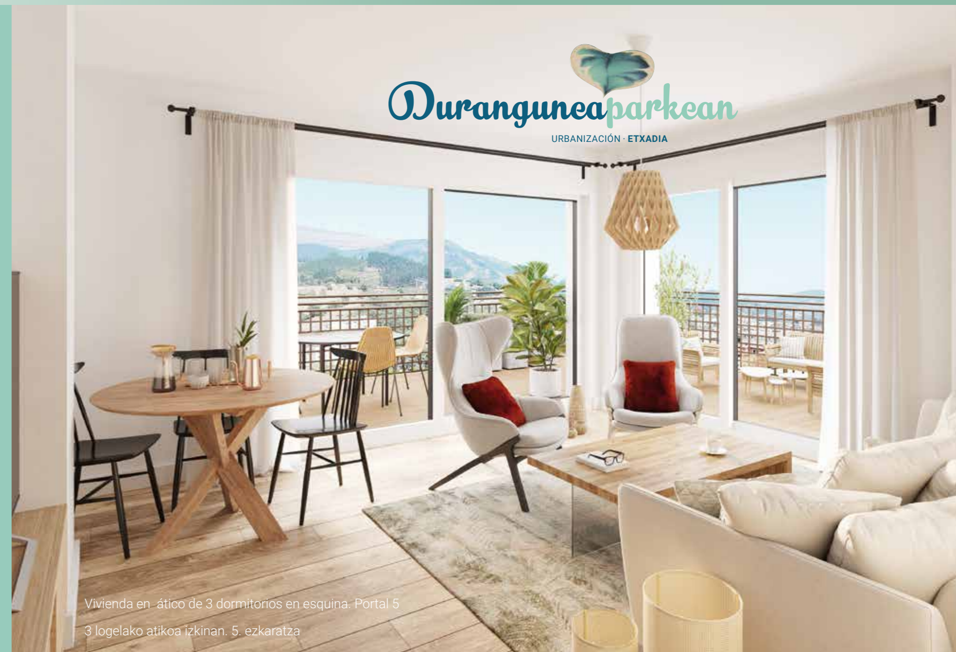
Vivienda en ático de 3 dormitorios en esquina. Portal 5 3 logelako atikoa izkinan. 5. ezkaratza